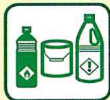
DECHETS DIFFUS SPÉCIFIQUES

déchets ménagers de produits chimiques: acides, soude, ammoniac, comburants, engrais et phytosanitaires ménagers