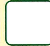
DÉCHETS NON VALORISABLES