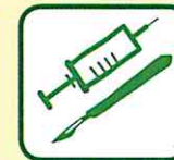
DECHETS D'ACTIVITÉS DE SOIN A RISQUES INFECTIEUX