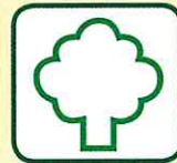
DECHETS VERTS TAILLE