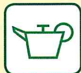
HUILES DE VIDANGE