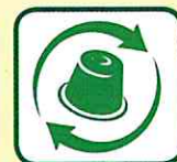
CAPSULES DE NESPRESSO