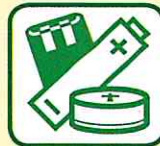
PILES, NÉONS AMPOULES